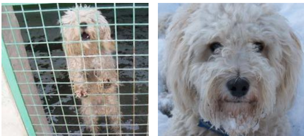
Pax in der Tötungsstation und nun im neuen Zuhause !