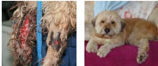
Vagabundo schwer verletzt lebt nun glücklich und schmerzfrei !

Verletzte Tiere haben auch die Chance auf eine glückliche Zukunft verdient!