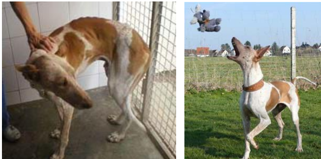
Benito vorher und nun in seinem neuen Leben !

Obwohl viele der Hunde keine schöne Vergangenheit hatten, haben sie erstaunlich wenig Probleme ein ganz normales Leben zu führen. Ihre Dankbarkeit kennt keine Grenzen.